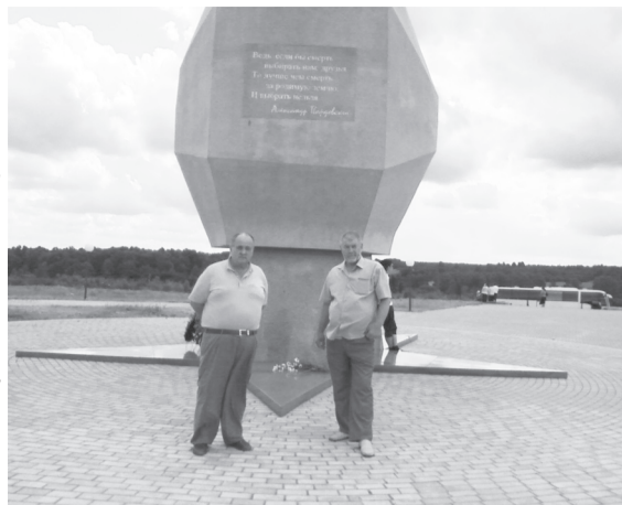
Мемориал «Богородицкое поле»

А 22 июня в 4 часа утра в сквере «Памяти героев» писатели вместе с жителями город приняли участие в траурной церемонии «Свеча памяти», посвященной 70-летию со дня начала Великой Отечественной войны. На митинге с болью было