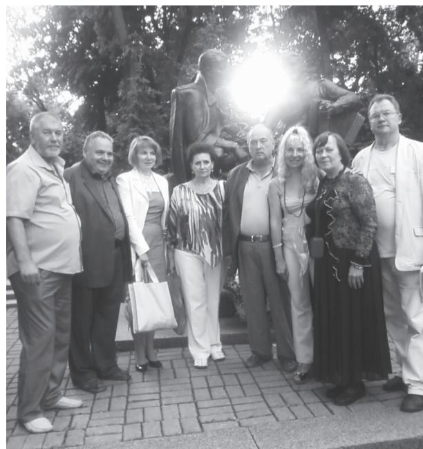
Со смоленскими писателями