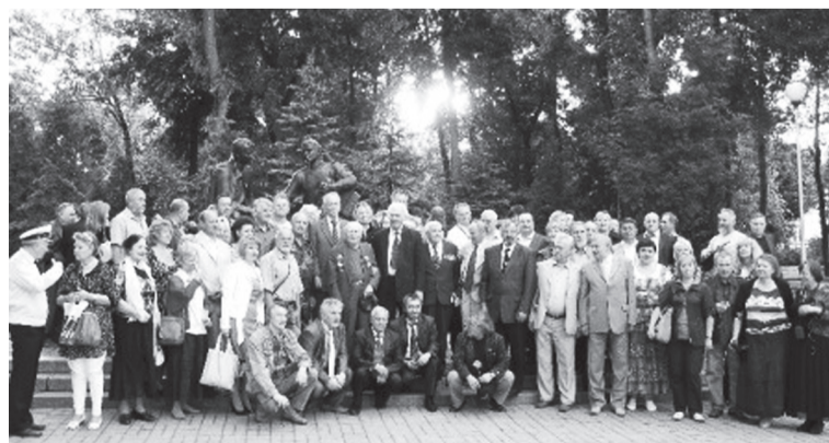
Фотография на память