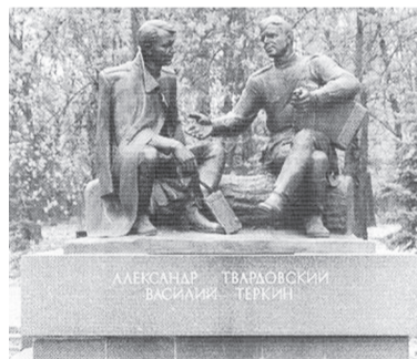
Памятник А.Т.Твардовскому и Василию Тёркину в Смоленске

ставился вопрос о необходимости сбережения, ограждения русского языка от инословия, сквернословия и других чуждых влияний, предложил всем вместе бороться за чистоту «великого и могучего». «Однако одной поддержки на словах мало, необходима серьезная просветительская работа, чтобы