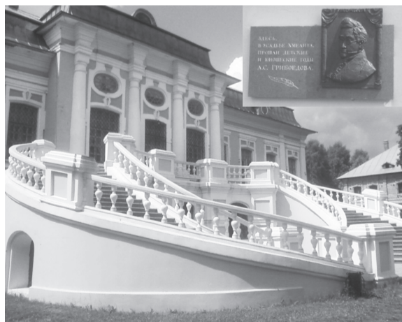
Парадная лестница усадьбы Грибоедовых

Все в усадьбе производит хорошее впечатление, настраивает на