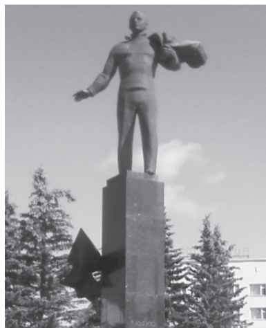
г. Гагарин. У памятника первому космонавту

но остался в почти первоначальном виде. В Отечественную войну 1812 года здесь останавливался маршал Мюрат, и его усилиями дом не был разграблен французами. Не тронули его и большевики ни в годы гражданской войны (имение охранялось местными крестьянами), ни в годы первых пятилеток. Во Вторую мировую войну в имении находился какой-то штаб немецких оккупационных войск. Уходя, немцы почему-то взорвали лишь колокольню, с которой до 30 км просматривались окрестности, а дом не тронули. И только случайный пожар в 1956 году нанёс значительный урон имению, и потому, при традиционно скудном финансировании подобных музеев, усадьба до сих пор ещё полностью не восстановлена. Но работы идут, и, мы думаем, будут скоро закончены...»