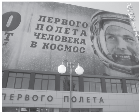
г. Гагарин. Музей космонавтики