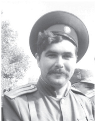
Из цикла «Прощание»