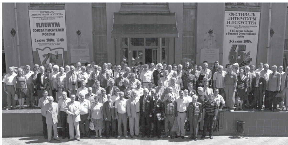
Участники выездного Пленума Союза писателей России у входа в областиную научную библиотеку имени Н. Н. Асеева.