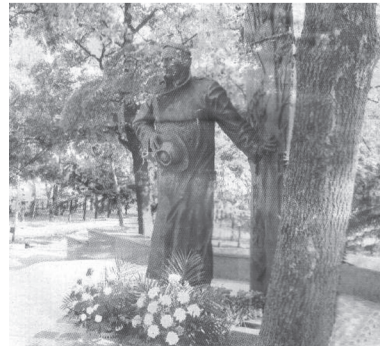
Памятник Константину Воробьеву (авт. В. Клыков)