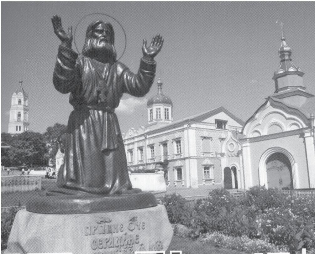
Памятник Серафиму Саровскому в Коренной пустыни