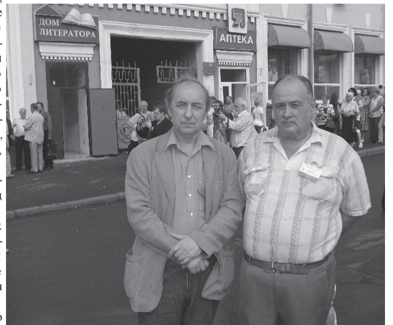
У Курского Дома литератора

Знакомые мне места выглядели драгоценными веснушками на обновленном лице города. Я, конечно же, узнал гордость того времени, новый, монументальный железнодорожный вокзал, выстроенный на месте разбомбленного старого. Красная площадь с двумя одинаковыми зданиями, симметрично обозначившими начало улицы Ленина, и здание администрации Курской области как и в те времена, и Знаменский собор, замыкающий Красную площадь, – в нем тогда располагался двухзальный кинотеатр «Октябрь» с парком Культуры и Отдыха вокруг. Но это