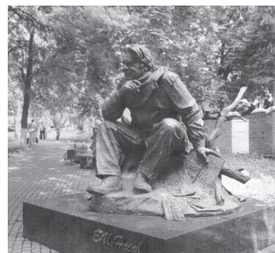
Памятник Евгению Носову (авт. В. Клыков)

В номере: Алексей Береговой Фестиваль литературы и искусства в Курской области. Очерк Пленум Союза писателей России 1 стр.