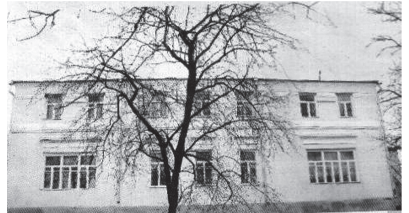
Дом-усадьба Афанасия Фета

В 14 часов на тех же автобусах мы выехали в Воробьевку – усадьбу русского поэта Афанасия Афанасьевича Фета.