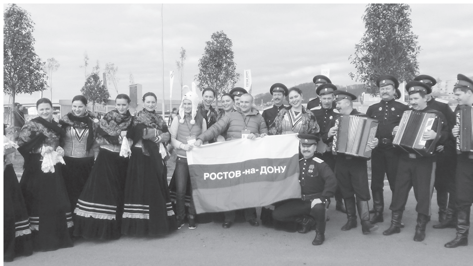
Сочи. Олимпиада. 2014 год

А вот сценка из сравнительно недавнего прошлого: из времён Великой Отечественной или Гражданской войн. Казаки в щегольских кубанках на головах, в красных рубахах и синих шароварах с лампасами. В руках — неизменные шашки. Мелодия, вначале, когда на сцене мужчины, похожа на героический марш первоконников-будённовцев. Затем появляются казачки в нарядных голубых приталенных блузках, в длинных красных юбках, с большими расписными шальями на плечах, и музыкальное сопровождение меняется на плавное, размеренное, — подстать медленному, задумчивому течению Дона. Причём, если у казаков