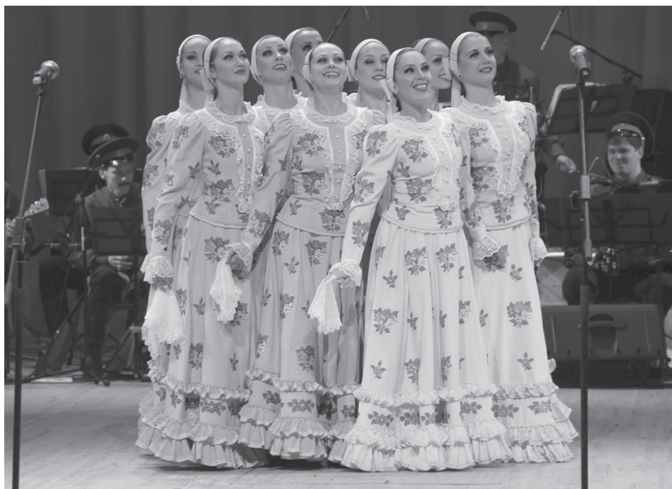
«Из-за Дона песню выведу...»

Как только Красная Армия разгромила окружённую в Сталинграде группировку фельдмаршала Паулюса и освободила город, — туда сразу же для укрепления боевого духа наших войск, направили казачий хор. Артисты разделились на две фронтовые бригады и ещё несколько месяцев колесили по разбитым дорогам войны с концертами. А 1945 год был ознаменован для коллектива не только всеобщей радостью — великой победой над врагом, но и важным гастрольным событием: выступлением в зале имени Чайковского в Москве. В дальнейшем концерты в престижных московских залах были не редкость. На сцену Кремлёвского Дворца «Доно-Кубанский казачий хор» тоже выходил, и не однократно. Правда, как участник больших «сборных» концертов.