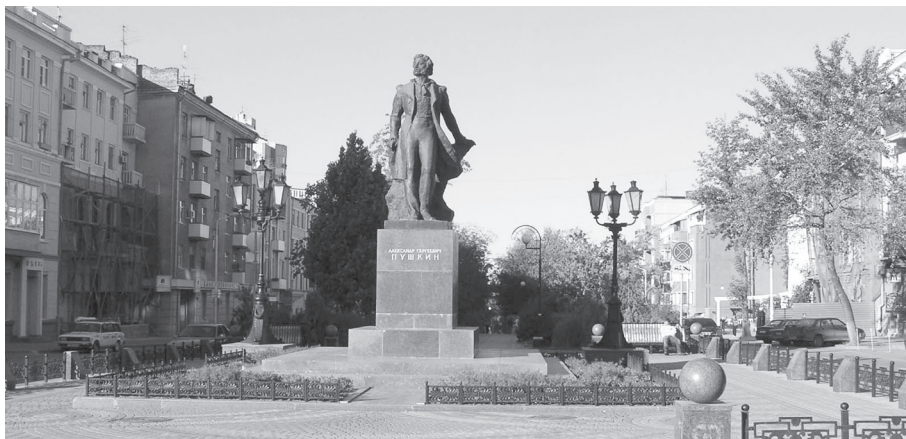
Памятник А.С. Пушкину в Ростове-на-Дону