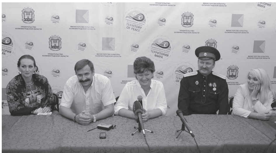
Калининград, 2013 год. Фестиваль «Территория мира»

Подводя итог всему вышесказанному, хочется акцентировать, что верное служение самобытному народному искусству Дона — залог успешного движения прославленного коллектива по большому нелёгкому, но всегда благородному пути к миллионам человеческих сердец. Впереди у Государственного академического ордена Дружбы народов ансамбля песни и пляски Донских казаков им. Анатолия Квасова, несомненно, яркое будущее, большие творческие планы, в новом сезоне интересные гастроли в Китае и Чехии, многочисленные выступления в городах России и Ростовской области. Ансамбль растёт и развивается, радуется зрителей новыми концертными номерами.